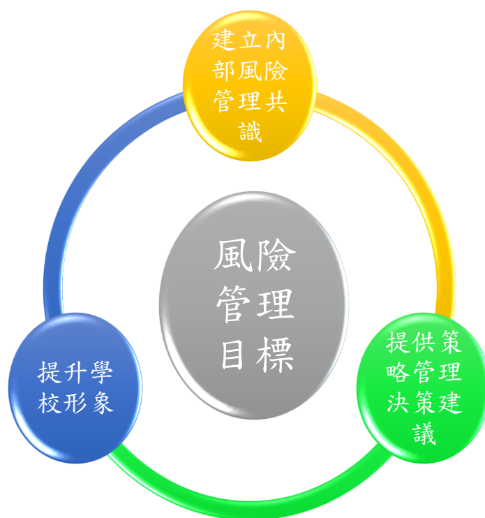
圖 2 風險管理目標

本校將風險管理目標設定為：建立內部風險管理共識、提供策略管理決策建議及提升學校形象。