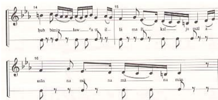
譜 1：穆瓦莎赫 6